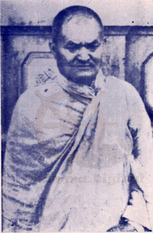
स्वर्गीय भिक्षु ज्ञानसागर महास्थविर