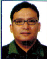
अमनसिद्धी मानन्धर नाति