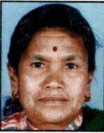
१४) अष्टमाया महर्जन टेवहाल