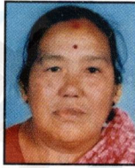
७) तीर्थमाया महर्जन बहती