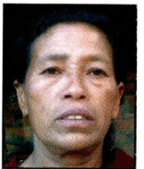
१७) नानीमयजु महर्जन बहती