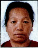
१८) महालक्ष्मी श्रेष्ठ लाजिम्पाट