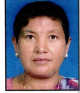
२१) नानी महर्जन जोगिपाको