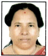
१२) सानुमाया महर्जन लाजिम्पाट