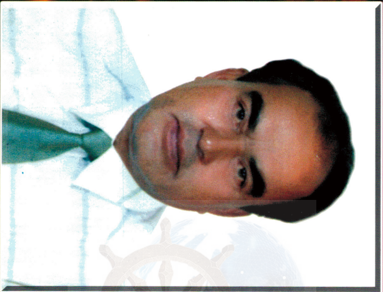
ଶ୍ରୀ ଅଭିରକାଞ୍ଚି ସ୍ଵାମିନି