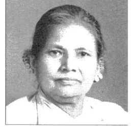
(दिवंगत आशामाया शाक्य)