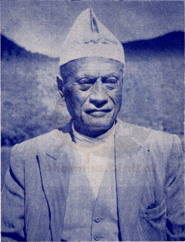
स्वर्गीय हेरामान ताम्राकार