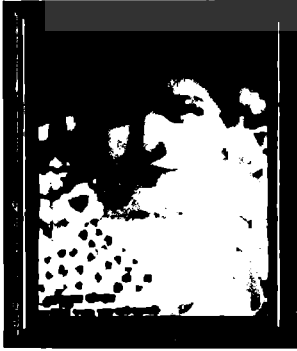
मार्या साममाया रजित