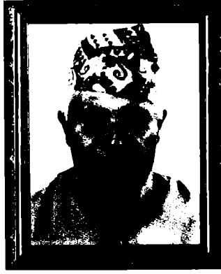
दादा हरिमान रजित