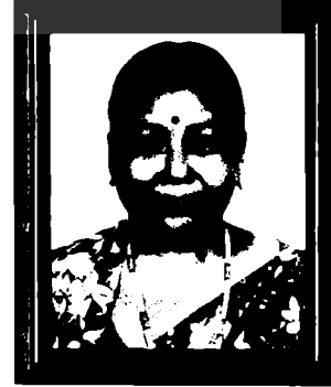
मार्या जनकमाया रजित