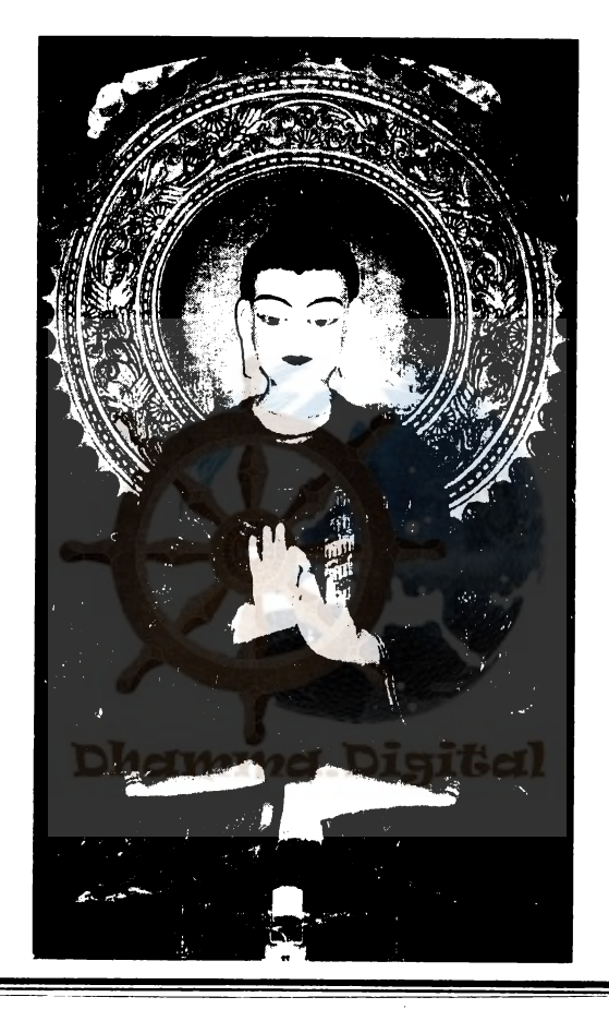
रेय धम्मरक्खित नेपाल बुद्धसासन वंसालंकार सिरि संघमहानाय अग्गमहापण्डित दिवंगत प्रज्ञानन्द महास्थविरज्यूं थम्हं हे रंगपाना नयार याना बिज्याम्ह श्रीशाक्यसिंह विहारया बुद्धया मूर्ति