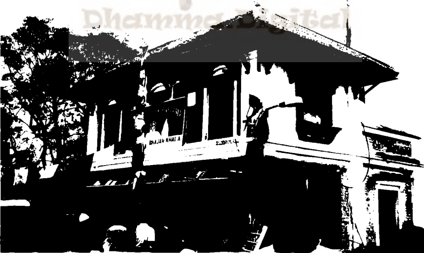
ज्ञानमाला भजन खलः, स्वयम्भू