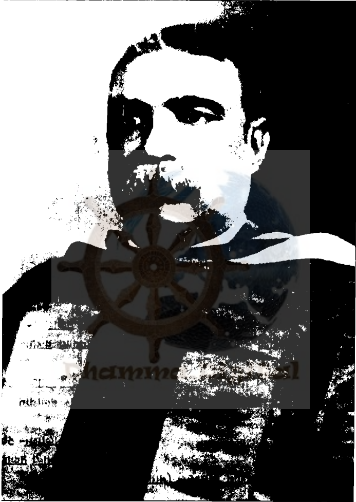
सर आशुतोष मुकजी (सन् १८६४-१९२४)