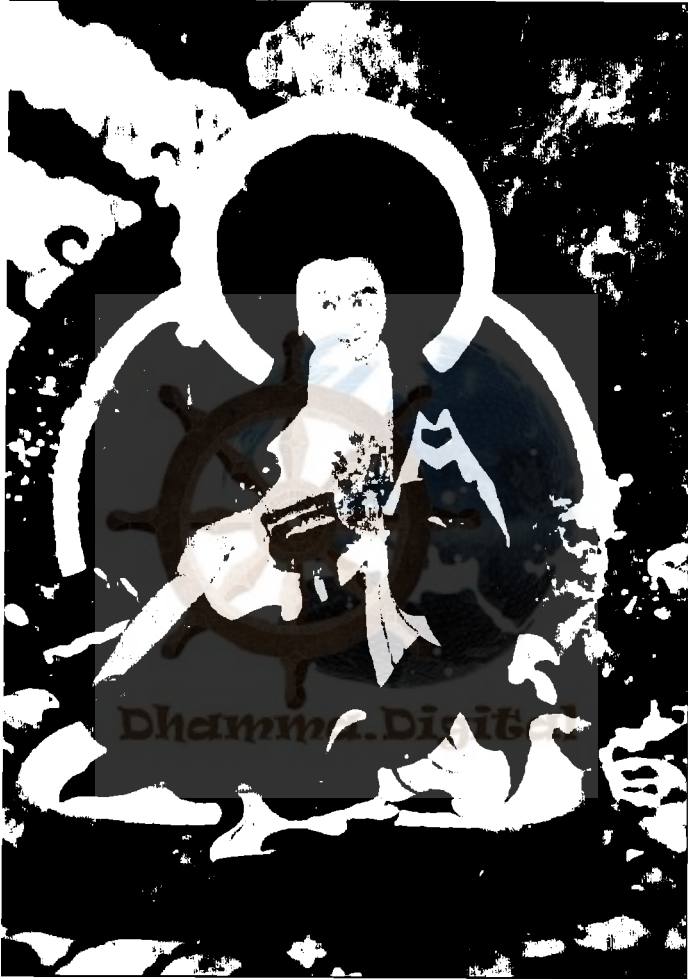
आचार्य शान्तिदेव (सातौ शताब्दी)