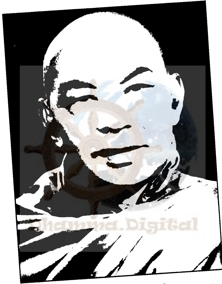
भिक्षु अमृतानन्द महास्थविर (सन् १९१८-९०)