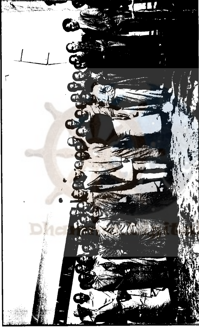
अग्रश्रावक-अस्थिघातु विदाइको दिन (२२ नवम्बर १९५१)मा गौचरण-हवाई अड्डामा खिचिएको फोटो श्री ५ त्रिभुवन (बीचमा) का साथ नेपालका भिक्षु महासंघ र अन्य आगन्तुक विदेशी भिक्षुहरू