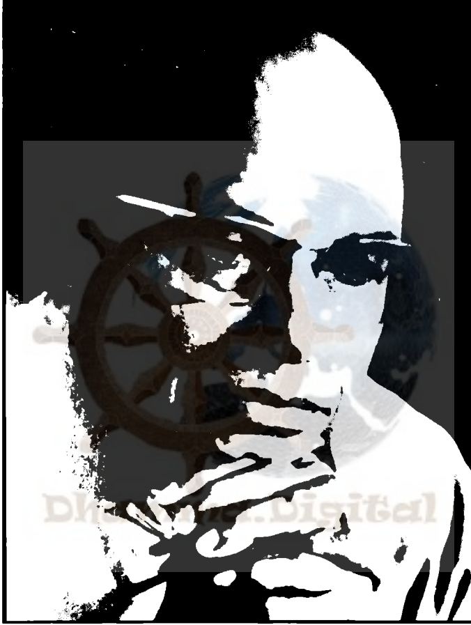
डा. भिक्षु वालपोल राहुल (सन् १९०७-९७)