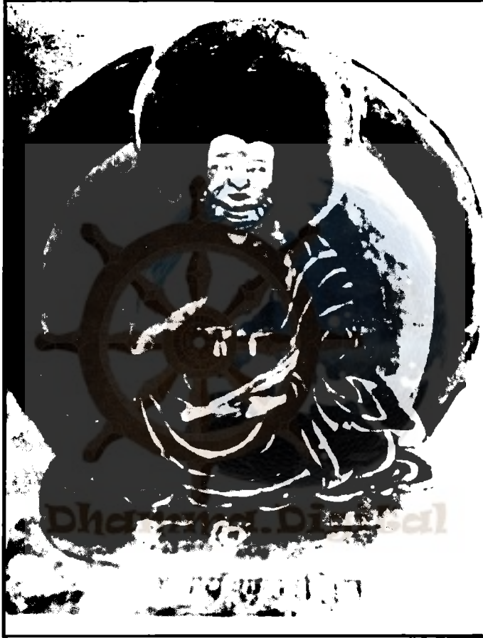
आचार्य शान्तरक्षित (सन् ६५०-७५०)