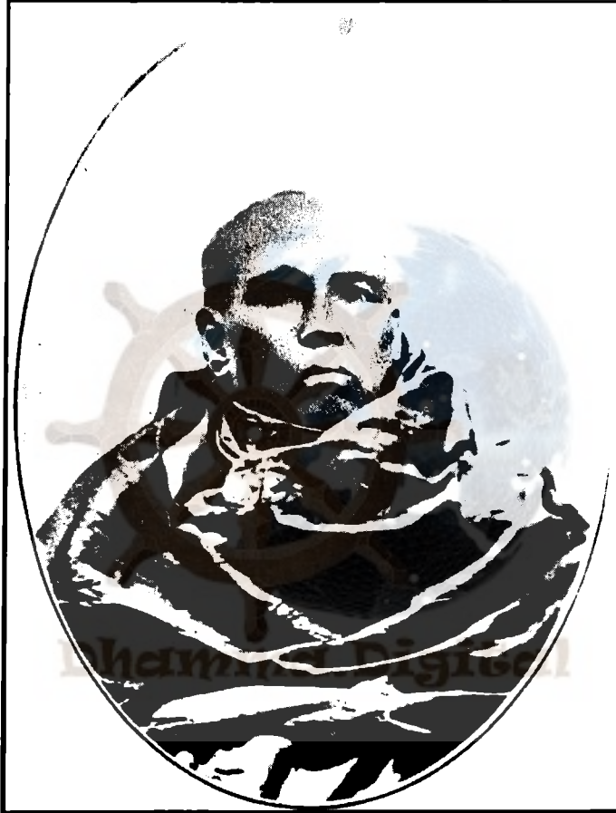
भदन्त लेदी सयादो महास्थविर (सन् १८४६-१९२३)