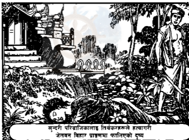
सुन्दरी परिव्राजिकालाई तिर्थंकरहरूले हत्यागरी जेटवन विहार प्राङ्गणमा फालिएको दृश्य

सुन्दरी परिव्राजिकालाई तिर्थंकरहरूले हत्या गरी जेत विहार प्राङ्गणको खाल्डोमा पुन लगाएका थिए । त्यसपछि उ परिव्राजिकालाई भगवान् बुद्धले हत्या गरी आफ्नो दुराचार क छोप्नका लागि उक्त खाल्डोमा पुरेर लुकाइराखेको हो भनी तिर्थंकरहरूले भगवान् बुद्ध माथि भूठो आरोप लगाएका थिए यसरी कुन पापको कारणले भगवान् बुद्ध जस्तो शुद्ध, निर्दोष व्यक्ति पनि यस्तो भूठो लाञ्छना एवं दोषारोपण सहनु परेको ?