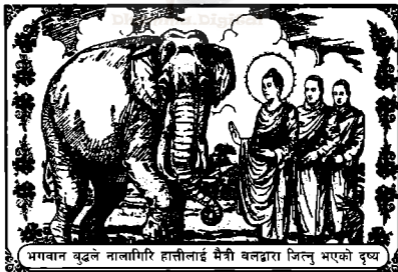
भगवान् बुद्धले नालागिरि हात्तीलाई मैत्री बलद्वारा जित्नु भएको दृष्य

उपदेश सुनिसकेपछि जनताले मुक्तिमार्ग देशना सुनी कोमल मनले नालागिरि हात्तीप्रति माया, ममता उत्पन्न गर्दै मैत्रीभावना अभ्यास गरे । अनि मूल्यवान् कपडा, हारहरू हात्तीलाई बक्स दिई नालागिरि हात्तीलाई धनपाल हात्ती नामाकरण गरे । त्यसपछि नालागिरि बुद्धको उपासक हात्ती बन्यो ।