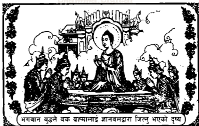
भगवान बुद्धले बक ब्रह्मालाई ज्ञानबलद्वारा जित्नु भएको दृष्य

बुद्धले दिनुभएको अनित्य, दुःख, अनात्मा विषयका धर्मदेशनाहरू बकब्रह्माको कानमा पसेन । स्वीकार पनि नगरिकन उसको धारणा नै ठीक छ भन्ने विचार लिइराखे । त्यसैले बुद्धले नित्य भनेको निर्वाणमागं मात्र हो । अर्को मार्गहरू अनित्य हो भनि उपदेश दिनुभयो । बक ब्रह्माले भगवान बुद्धले सोध्नुभएको प्रश्नको जवाफ पनि दिन सकेन । पछि भगवान बुद्धसंग ऋद्धि देखाएर जीत हार हेर्ने निर्णय गर्‍यो । बक ब्रह्मा खुशी भएर भगवान बुद्धले नदेख्नेगरी आफ्नो शरीर लोपगर्न वारम्बार कोशिस गरेतापनि भगवान बुद्धको शक्तिले लोप गर्न सकेन । त्यसपछि तथागत शास्ताले आफ्नो शरीर सानो पारेर लोप गरी बक ब्रह्माको आँखीभौँ माथि चंक्रमण गरेर ऋद्धि देखाउनु भइ बकब्रह्मालाई दमन गर्नुभयो ।