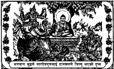
भगवान् बुद्धले मारदेवपुत्रलाई दानबलले जित्नु भएको दृष्य

भयानक डरलाग्दा मार सेनागणहरू भाग्दै हटेर जानासाथै पूजागर्दै रहनु भएका देव, ब्रह्माहरूले फेरी बोधिसत्व सिद्धार्थ कुमारको अगाडि दर्शन भक्तिभाव अर्पण गर्दै पूजा गरे । बोधिसत्व पनि आनापान सतिपट्टान भावना लगातार अभ्यास गर्दै जाँदा रातको प्रथम याममा पुब्बेनिवास ज्ञान, रातको मज्झिमयाममा दिव्वचक्खु ज्ञान, विहानी पख सुर्योदयको समयमा पतिच्च समुप्पाद ज्ञानलाई मननगरी स्मृति प्रस्थान विपश्यना ध्यान अभ्यासगर्दै आसवक्खय ज्ञान संग संगै सर्वज्ञज्ञानलाई पनि प्राप्त गर्नुभई बुद्धत्व प्राप्तगर्नु भयो । यसरी मारदेवपुत्रलाई जित्नु भयो ।