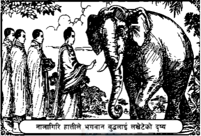
नालागिरि हात्तीले भगवान बुद्धलाई लखेटेको दृष्य