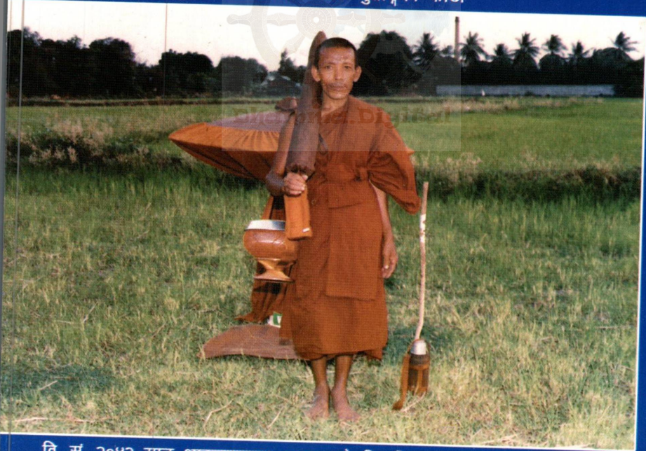
वि. सं. २०४२ साल थाइल्याण्डमा अध्ययनको सिलसिलामा सातसय पचास भिक्षुहरूको समूहमा ३० दिनसम्म पैदल घुताङ्गको फोटो