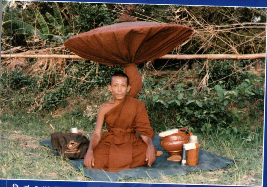
वि. सं. २०४१ साल थाइल्याण्डमा अध्ययनको सिलसिलामा सातसय भिक्षुहरूको समूहमा ३० दिनसम्म पैदल घुताङ्गको फोटो