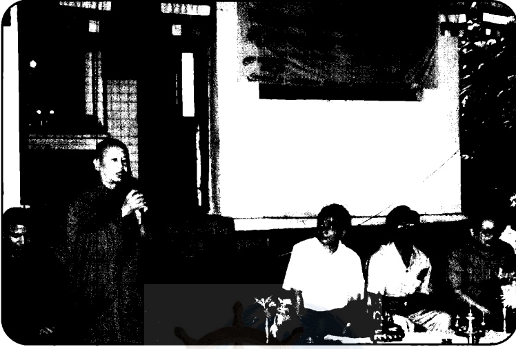
सतौं बौद्ध जागरण प्रशिक्षण शिविरमा सम्बोधन