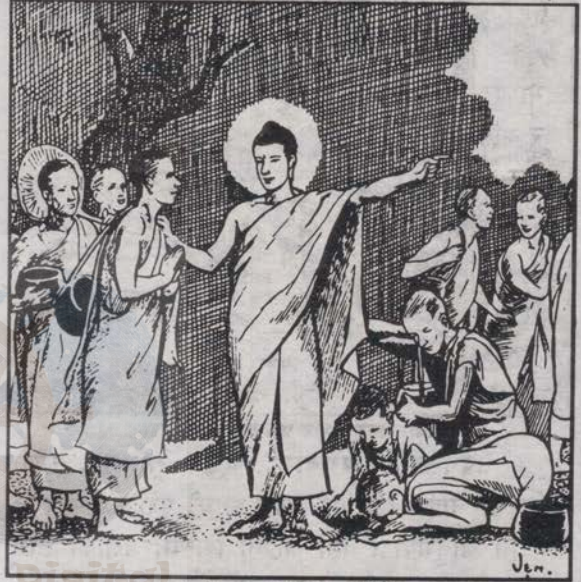
धर्म प्रचारार्थ निर्देशन दिँदै

आफू त्रिरत्नका उपासक भएको कुरो बुद्धलाई बिनित्त चढाएर बुद्ध प्रमुख भिक्षुहरूलाई भोलिको भोजनको निमन्त्रणा दिई सो सेठ फर्के । पछि यशका ४ जना घनिष्ठ मित्रहरू पनि बुद्धशासनमा भिक्षु बन्न आए । यस्तै अझ यशका ५० जना साथीहरू पनि बुद्धशासनमा भिक्षु बन्न आए । यी सबैजना उच्चघरानियाँहरू थिए । बुद्धका नीति निर्देशन अन्तर्गत रही यिनीहरू धेरै समय नबित्दै अर्हत फल लाम्बी भए ।