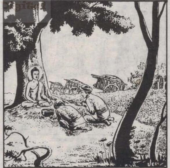
तपुस्स र भल्लिक दुई व्यापारी

त्यहाँ इच्छा अनुसार वसिसक्नुभए पछि बुद्धले भावी कार्यहरूको सम्बन्धमा विचार गर्नुभयो । प्रथमतः कल्पना गर्नुभयो - मैले पाएको ज्ञान अति गम्भीर छ । यी स्वार्थी जनताले बुझ्न गाह्रै पर्छ । तर पछि वहाँले आफ्नो महाकरुणा तथा प्रज्ञाद्वारा देख्नु भयो -क्लेस तथा स्वार्थीभाव थोरै मात्र हुने मुमुक्षुहरूले धर्मलाई बुझ्ने छन् । जस्तै कमलको फूलहरूमा सूर्यको किरणसम्म पाएपछि पानी भन्दा माथि उम्रेर फूल फुल्ने छन् । तसर्थ मैले यो उत्तम ज्ञानलाई आफैमा मात्र राखि छोड्नु ठीक छैन । धर्मप्रचार गर्नु आवश्यक छ ।