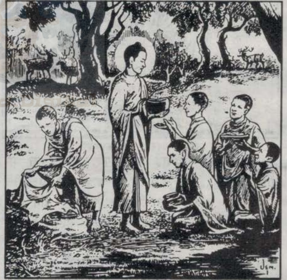
पंच भद्र वर्गीयको बुद्ध प्रति भद्रा

भगवान बुद्ध आउनुभई तयार पारिएको आसनमा बस्नुभयो । अनि भन्नुभयो- भिक्षुहरू हो ! मैले अमृत धर्म पाइसकेको छु । त्यो तिमीहरूलाई बताउने छु । म तिमीहरूलाई बाटो देखाउने छु । यदि त्यसलाई तिमीहरूले सुन्यौं मन लगायौं र भने अनुसार आचरण गर्नु भने धेरै समय नबित्दै आफैले बुझ्ने छौं । अर्को जन्ममा भनी पर्खेर बस्नु पर्दैन । यही जन्ममा फल पाउने छौं । मैले बोलेको बचनको सत्यता अहिले तुरुन्तै देख्ने छौं । त्यस्तै जन्म मरणको दुःखबाट मुक्त अवस्थामा पुग्नेछौं ।