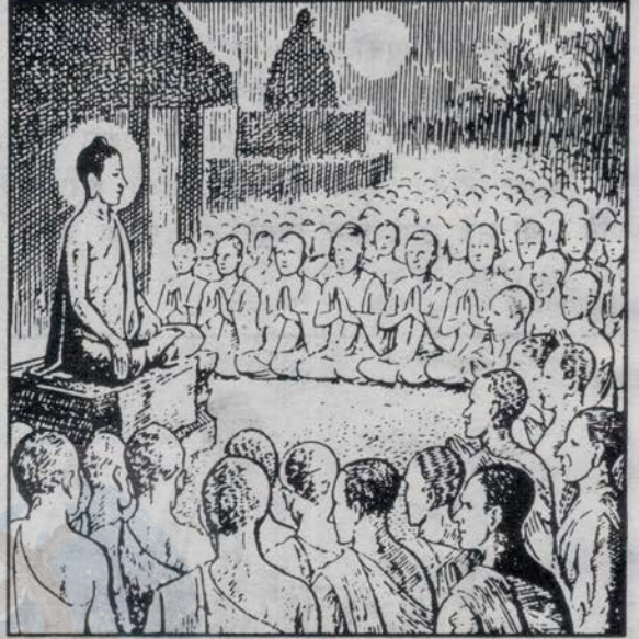
भिक्षु संघलाई अनुशासन

भिक्षुहरू सामेल भएका थिए । वहाँहरू ना ना दिशामा धर्मप्रचारार्थ जानुभई आ-आफ्ना कार्यप्रगति सुनाउन आएका थिए । यसको लागि कुनै पूर्व-योजना थिएन । यस्तो अचानक हुने भेला दुर्लभ हुन्छ । यसले भगवान् बुद्ध सहित अर्हत भिक्षुहरूलाई अति सन्तुष्टि मिलेको थियो ।