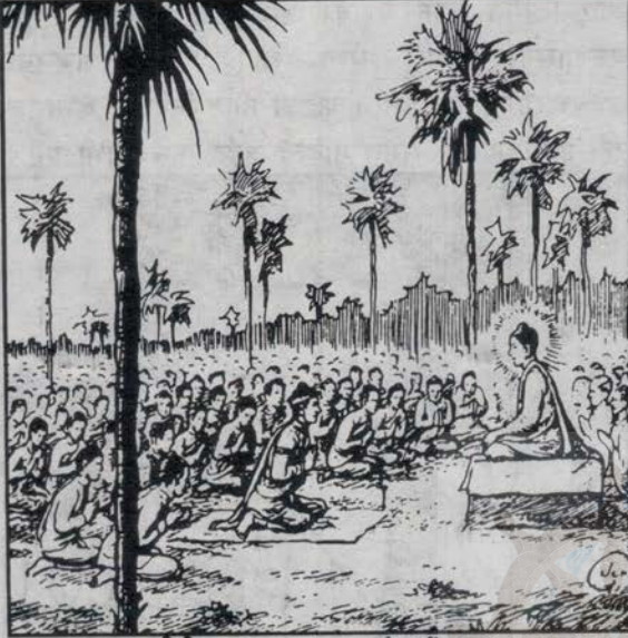
बिम्बिसार प्रमुख प्रजालाई धर्मदेशना

छोडाउनु भई आफूले पाएको नयाँ ज्ञानका कुरा बुझाईदिनु भयो । यसले उनीहरू सानै खुशी भएर बुद्धका शिष्य बने । उनीहरूका एकहजार शिष्य सन्यासीहरू पनि बुद्धका शिष्य भए । नाइके तथा अनुयायीहरू सबैजना अर्हत (तृष्णा रहित) भए ।