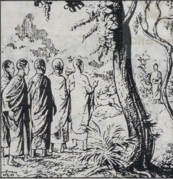
पंच भद्र वर्गीयहरू सल्लाह गरे

बुद्ध क्रमशः चारिका गर्दै ऋषिपतन मृगदाय वनमा पुग्नुभयो । पञ्चभद्रवर्गीयहरूले वहाँलाई टाढैबाट देखेर आपसमा सल्लाह गरे - लौ साथीहो ! भिक्षु सिद्धार्थ यतैतिर आउदैछन् । उनी लोभी लालची हुन् । तंपस्या भंग भएका हुन् । आरामसंग बस्न पल्केको हुन् । हामी उनलाई स्वागत अभिवादन गर्न जानेछैनौं । पात्र-चीवर पनि लिन जानेछैनौं । उनी यहाँ आएमा एउटा आसन मात्र दिने छौं । चाहेमा बस्लान् । न चाहेमा उभिएर नै बसुन् । यस्तो तपबाट भ्रष्टलाई को स्वागत गर्न जाला र ?