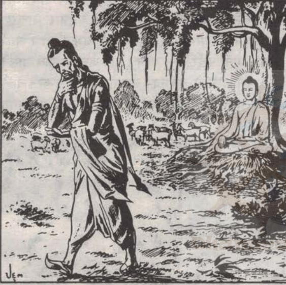
बुद्धसंग प्रश्न सोधेको ब्राह्मण

सम्यक सम्बुद्धलाई आफ्नो मनोवाञ्छित ज्ञान पाएकोमा बडो सन्तोष लाग्यो । तसर्थ वहाँ बोधिमण्डपमै आनन्द-मग्न भई बस्नुभयो । यो आनन्द क्लेशसंग युद्ध गर्दाको अनेक असह्य दुःखहरूबाट मुक्त हुनाले पाइएको हो । यहाँबाट उहाँ एक नजिकको वर वृक्षमुनि बस्न जानुभयो । त्यहाँ एकजना ब्राह्मण आइपुगे । उनले शिष्टाचार पूर्वक सन्चो-सुविस्ता सोधिसकेपछि फेरि सोधे-भो गौतम । यथार्थमा कस्तोलाई ब्राह्मण भनिन्छ ? कसलाई घरानियाँ भनी भन्नुपर्छ ?