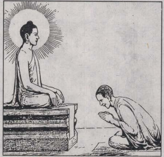
गौतमी भिक्षुणी भइन्

भिक्षु आनन्दले फर्केर आई भगवान् बुद्धलाई जम्मै कुरा बिन्ती गर्नुभयो । अनि भगवान् बुद्धले भन्नुभयो- “आनन्द ! स्त्रीहरू रहेको धर्म विनय धेरै