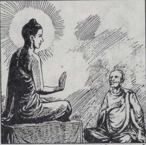
देवदत्तले बुद्धसँग आफूलाई संघका नाइके बनाई विनुहुन अनुरोध गर्दै

पाइनेछैन । तर देवदत्त आफ्नो विचारमा अडिग रह्यो । भगवान् बुद्धसँग यसको लागि धिपि नै गरिरह्यो । भगवान् बुद्धले यसकुरामा सहमति नदिनु भएता पनि राजकुमारका पिता राजा बिम्बिसार भने देवदत्तको विचारसँग सहमत थिएनन् । उनी भगवान् बुद्धका पक्का अनुयायी थिए ।