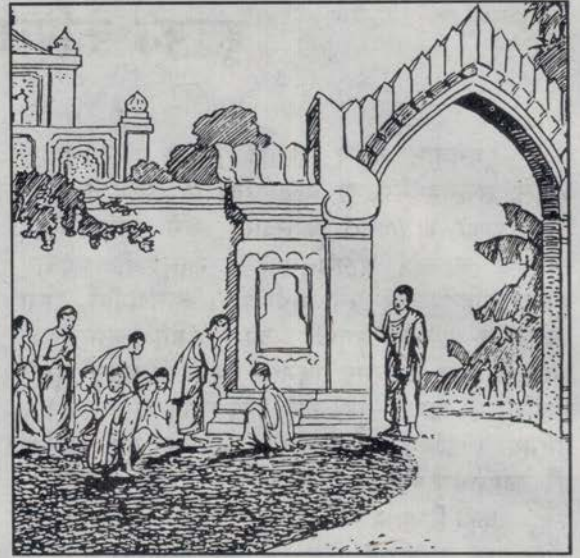
गौतमी बुद्ध विहार ढोकानिर रोई उभिइरहिन्

लामो बाटो हिँड्नाले महाप्रजापति गौतमी सहित ती महिलाहरूका खुट्टा सुन्निएका थिए । जीउभरि धूलो जमेको थियो । उमेरले बूढी भइसकेकी महाप्रजापति गौतमी भगवान् बुद्धको विहारको ढोकानिर सुँक सुँक रोई उभिइरहिन् । भिक्षु आनन्दले वहाँलाई देखेर किन यसरी दुःखमानी उभिईबसेकी भनेर सोध्नुभयो । अनि गौतमीले जवाफ दिइन्- “भन्ते आनन्द ! भगवान् बुद्ध महिलाहरूलाई भिक्षुणी बन्ने अनुमति दिनुहुन्न । मलाई