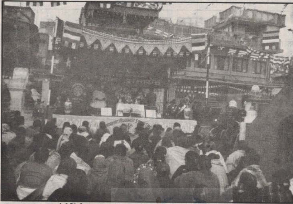
धर्मकीर्ति विहारको तर्फबाट आयोजना भएको सम्मान समारोहको दृश्य

लुम्बिनीमा सम्पन्न प्रथम विश्व बौद्ध सम्मेलनमा यसै धार्मिक कार्यहरू गर्नुभएको हुँदा उहाँहरूलाई धार्मिक व्यक्तिको रूपमा सम्मान गरिएको हो । भविष्यमा पनि उहाँहरूले धार्मिक व्यक्तिकै रूपमा रहेर आ-आफ्ना पदिय दायित्व निभाउने आशा राख्छु ।