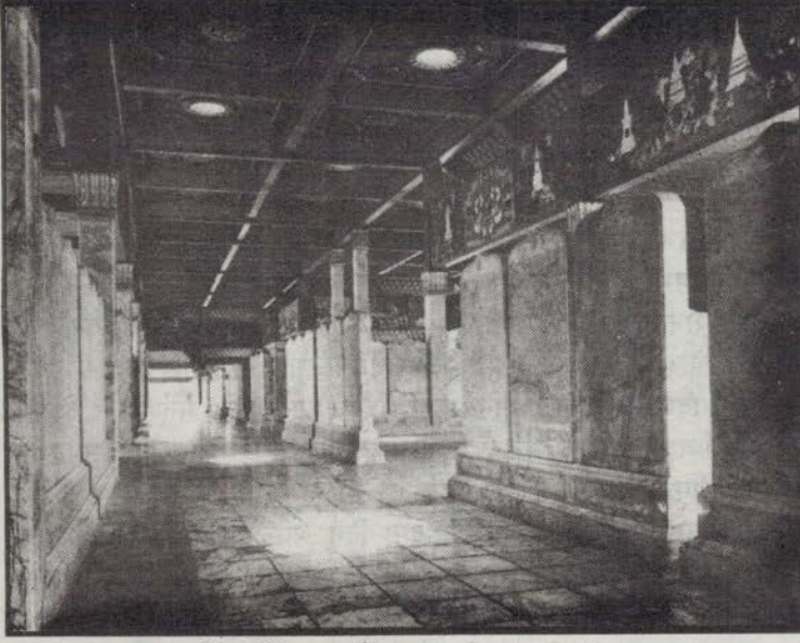
पालि त्रिपिटक कुँदिएको संगमरमरको दृश्य

तिर्नुपर्छ । अरू अरू फोहर कागज पनि फाल्न मनाही छ ।’