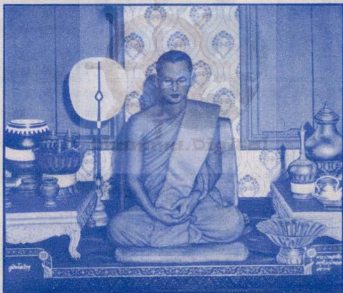
थाइ नरेश भूमिबल भिक्षु हुँदाको दृश्य