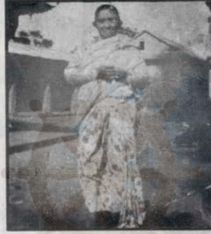
माजु : लक्ष्मीप्रभा २०४४ वैशाख माँया ख्वा: स्वयगु स्वन्हुन्ह्यो मद्गुदिं