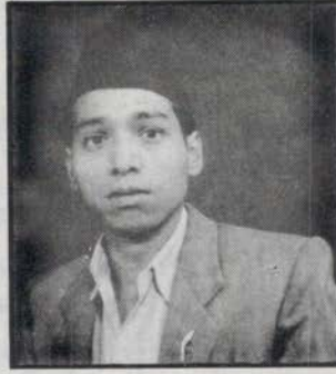
किजा : आर.के. हिमाल (रत्नकाजी) कंसाकार वि.सं. २०३९ जेष्ठ २० गते मद्गुदिं