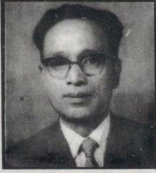
बा : कुलरत्न कंसाकार वि.सं. २०३९ आषाढ २२ गते मद्गुदिं