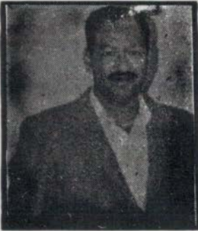
बुदिं ने.सं. १०६७ मद्गुदिं ने.सं. १११८ सिलाश्व षष्ठि

दिवंगत जुयादीपि सकल परिवारया पुण्य-स्मृतिसं निर्वाण कामना याना पि