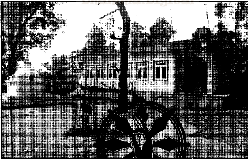
मैत्री चैत्य र विपश्यना ध्यान कक्ष, पोखरा