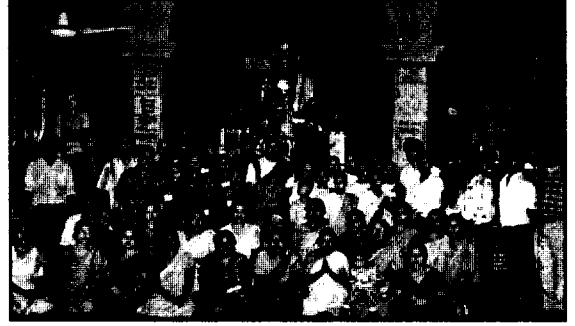
बुटवलको बौद्ध परियत्ति शिक्षा पटिवाट

बौद्ध धर्मावलम्बी बालबालिकाहरूलाई बौद्ध शिक्षा दिलाउने, बौद्ध शिक्षाको प्रचार प्रसार गर्ने तथा