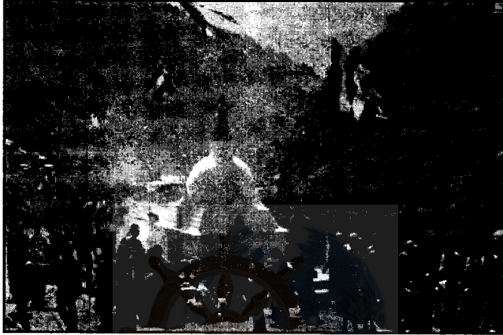
नवनिर्मित चैत्य उद्घाटन पछि पूजा-पाठको दृश्य

सुविधायुक्त एक होटलमा चांजोपांजो मिलाएका रहेछन् । सांभ्रपख क्षणिक बेनी बजारको अवलोकन एवं सुन्दर प्रकाशपुञ्जको मध्यस्थतामा अवस्थित चैत्यको दृश्यावलोकन पनि गर्‍यो । तत्पश्चात होटलको गर्भमा समावेश भएका हामी भोलिपल्टको प्रभातकालीन सूर्योदयसंगै बाहिरियौं ।