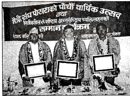
मैत्री संघ पोखराको पाँचौं वार्षिक उत्सवमा दोसल्ला ओढाई सम्मान