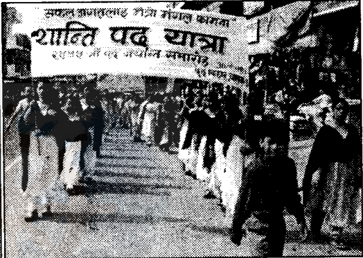
२५४५ औं बैशाख पूर्णिमाको उपलक्ष्यमा धरानस्थित शान्ति पदयात्रा