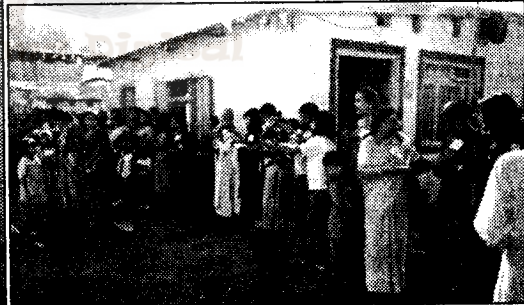
२५४५ औं बैशाख पूर्णिमाको उपलक्ष्यमा हेटौंडामा बुद्ध पूजा