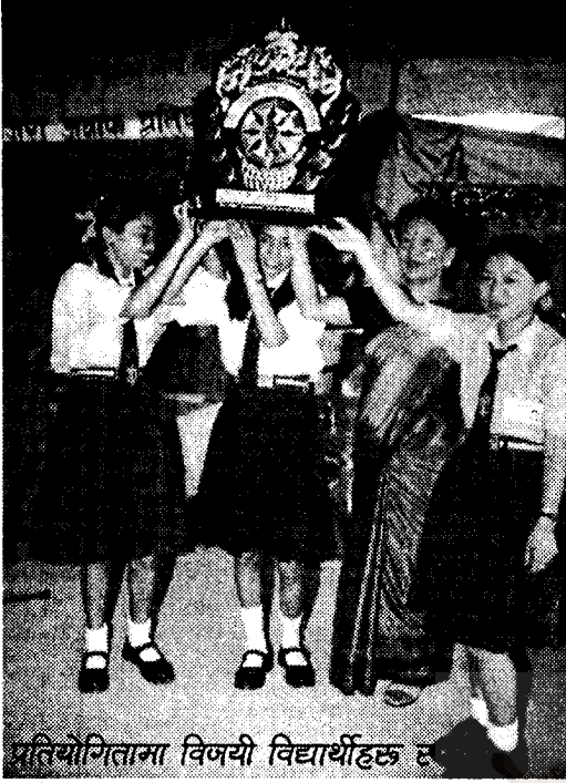
प्रतियोगितामा विजयी विद्यार्थीहरूले शिक्षिका रनिङ्ग शील्ड ग्रहण गर्दै