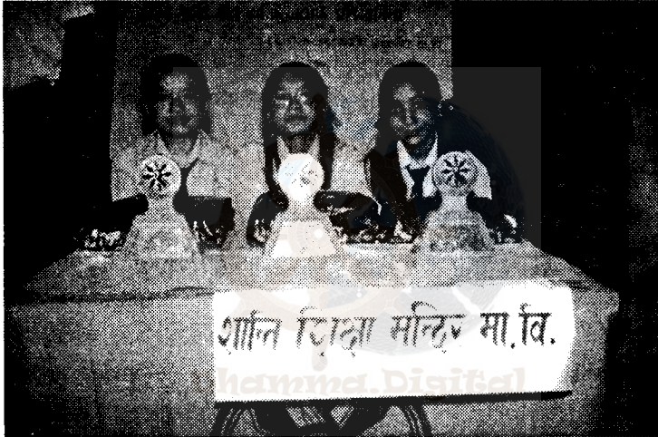
हाजिर जवाफ प्रतियोगितामा विजयी विद्यालयका विद्यार्थीहरू

२०५८ श्रावण २७ गते संचालित फाइनल प्रतियोगिता- यस फाइनल प्रतियोगितामा भाग लिने मौका प्राप्त गरेका विजयी विद्यालयहरूले यसरी आ-आपना स्थान ओगट्न सफल भएका थिए ।