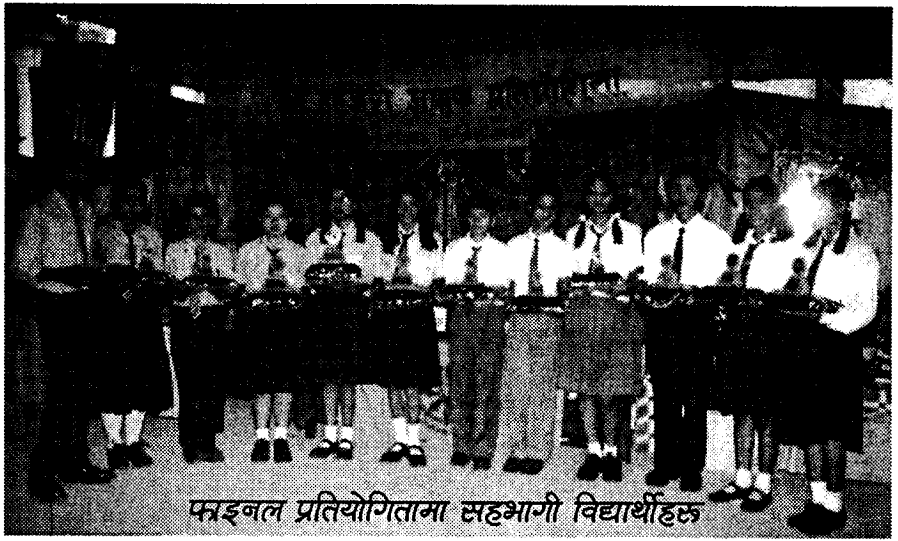
फाइल प्रतियोगितामा सहभागी विद्यार्थीहरू