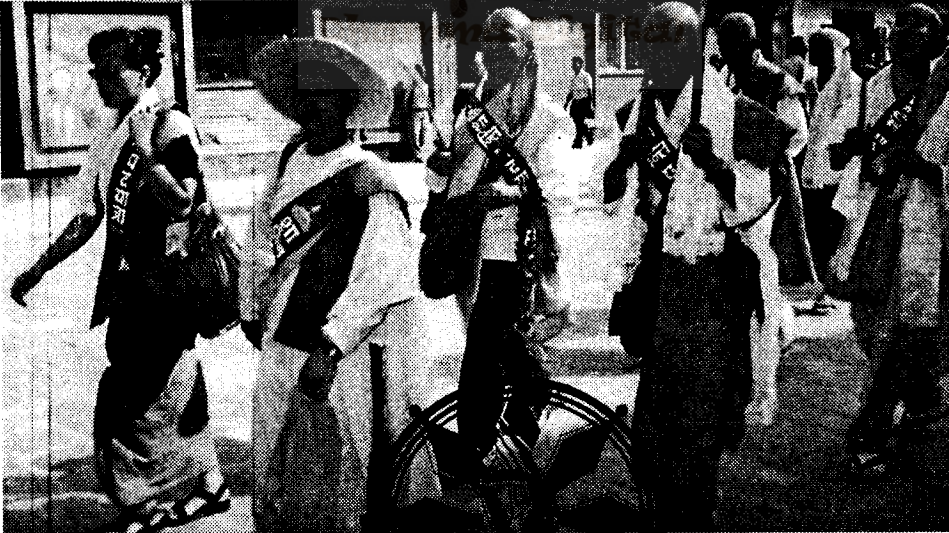
जापानको बौद्ध संस्था निप्पोनजुसु म्योहोरीले न्युयार्कबाट निर्मित विश्व शान्ति स्तूप उद्घाटनमा संलग्न हुन स्वदेशी तथा विदेशी धर्मचरुहरूको साथमा स्वनीसम्म शान्ति पैदल यात्रा