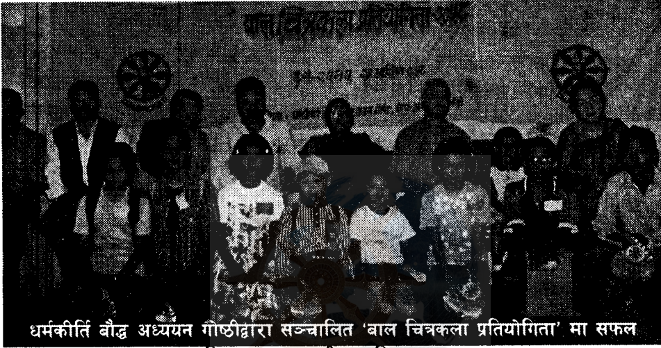
धर्मकीर्ति बौद्ध अध्ययन गौछीद्वारा सञ्चालित 'बाल चित्रकला प्रतियोगिता' मा सफल बाल-बालिकाहरू आदरणीय व्यक्तित्वहरूका साथमा