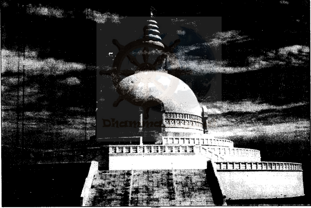
लुम्बिनीमा निर्मित शान्ति स्तुप