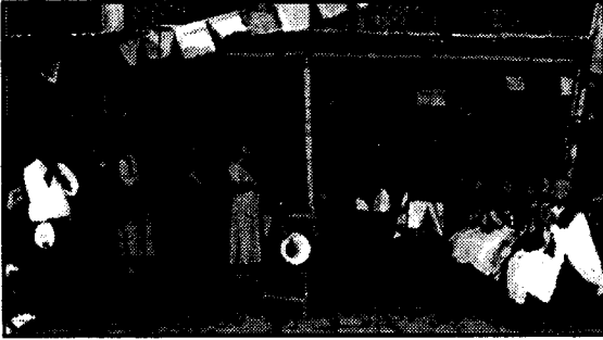
धर्मकीर्ति बौद्ध अध्ययन गोष्ठी समूहको तर्फबाट नमो बुद्धमा बुद्ध पूजा गर्दै ।

२०५८ आश्विन १३ गते, शनिवार । धर्मकीर्ति बौद्ध अध्ययन गोष्ठीले एकदिने (नमो बुद्ध) तीर्थस्थलको दर्शन कार्यक्रम आयोजना गरेको छ ।