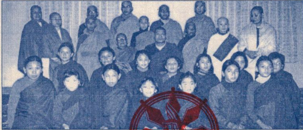
धर्मकीर्ति बौद्ध अध्ययन गोष्ठीद्वारा आयोजित अल्पकालीन प्रव्रज्या शिविरमा २०१९ का सहभागीहरू