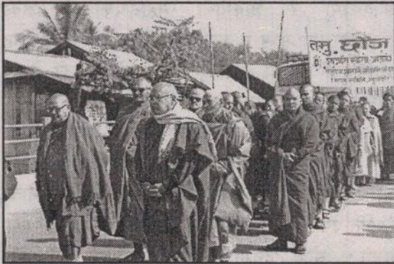
चतुर्थ ज्ञानमाला सम्मेलन धरानमा शान्तिपद यात्रामा सहभागी भन्ते, गुरुमाँहरू