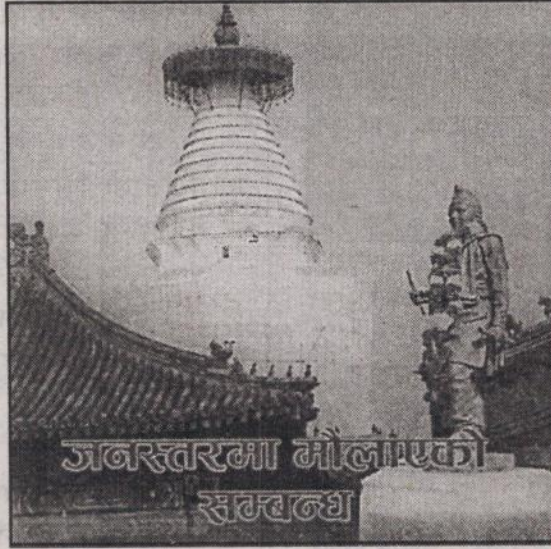
अरनिको समाजबाट स्थापित अरनिको प्रतिमा

मञ्जुश्री नेपाली जनताका सम्पूर्ण श्रद्धा पाएका आराध्य देवता हुन्। यिनी नेपाल उपत्यका जलमग्न रहेका बेला चीनको बुथाई शान (पञ्चशीर्ष पर्वत) बाट आएका कुरा पौराणिक ग्रन्थहरूमा लेखिएको छ। यिनी चीनबाट आउँदा दोलखामा बास बसेका थिए भनी उनको सम्झनामा त्यहाँ एउटा मन्दिर बनाइएको छ। यहाँ