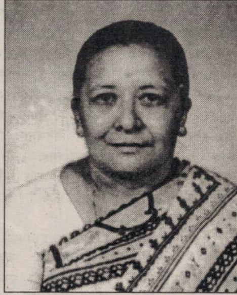
मदुम्ह मय्जु श्यामलक्ष्मी शिल्पकार लोकेश्वर टोल, ज्यावलालेख

अनिच्चावत संखारा, उप्पाद वय धम्मिनो उपज्जित्वा निरुज्झन्ति, तेसं ऊपसमो सुखो