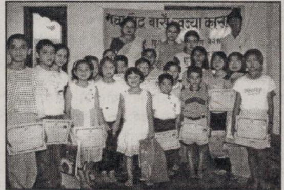
बालबौद्ध कथा लेखन प्रतियोगितामा सहभागीहरू र विजेताहरू