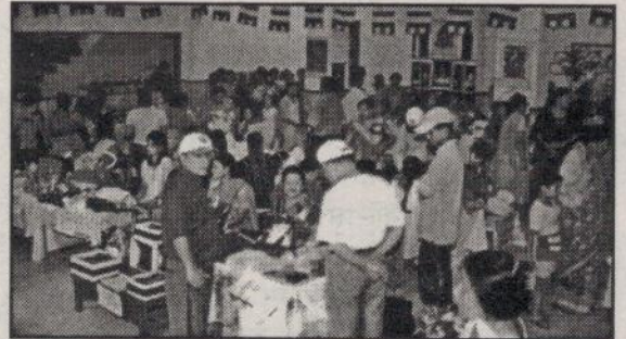
हस्तकला प्रदर्शनीया छगू भल्लक

उकिं जि सदां सदां धर्मकीर्ति बौद्ध अध्ययन गोष्ठी प्रति आभारी जुया च्वना ।