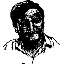
→ विश्व शाक्य

नेपाल सम्बत्को नयाँवर्षको उपलक्षमा शुभकामना आदान-प्रदानको कार्यक्रम थियो । शुभकामना आदान-प्रदान कार्यक्रममा एकजना संडगीत कर्मीको सम्मान कार्यक्रम पनि थियो । सम्मानित व्यक्तित्वको परिचय दिने क्रममा परिचयकर्ता संस्कृतिविद वक्ताले हिन्दू र बौद्धहरू एक आपसमा समभाव रहेको अवस्थामा केही वर्ष यता आएर बौद्ध जागरणको नाममा हिन्दू बौद्ध बीच विभेद उत्पन्न हुन गैरहेको मन्तव्य दिए पछि श्रोताहरू माफ्र खासखुस शुरू भयो । 'शुभकामना आदान प्रदान कार्यक्रममा यो सन्दर्भ रहित कुरा कहाँबाट आयो ?' एकथरी श्रोताले जिज्ञासा राखे । अर्को थरीले अभिमत पोखे— "बौद्धहरू हिन्दूहरूको मठ मन्दिर जाँदै मात्र हिन्दू बौद्धहरूको समभाव रहने सहिष्णु हुने अनि हिन्दूहरू आफैले विष्णुको नवौँ अवतार मानिएको बुद्ध धर्मावलम्बीहरूको बौद्ध गोम्बा विहारहरूमा हिन्दूहरू विर्सेर पनि नपस्दा भने धार्मिक सह-अस्तित्व र धार्मिक सहिष्णुता नतोडिने ? यो कस्तो समभाव ?"