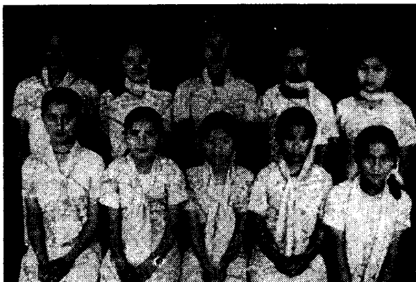
ध्यानकुटी बाल आश्रमका बालिकाहरू एकैरूपीय पोशाकमा

बनेपा प्राचीन नगर हो । यहाँ लायक दरवार पनि रहेको थियो; नेवार राजाहरूका राज्य नगरकै रूपमा परिचित बनेपामा आजकल दरवारको अवशेष पनि पुरिँदैछन् । जस्को चासो राख्ने काममात्र भएनन् इतिहाससम्म पनि स्मरण गर्ने कार्यहरू गर्न