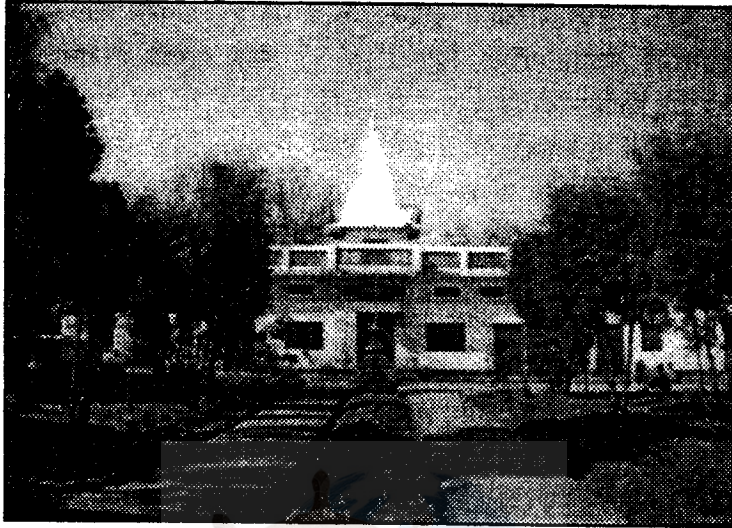
हालको प्रणिधिपूर्ण महाविहार