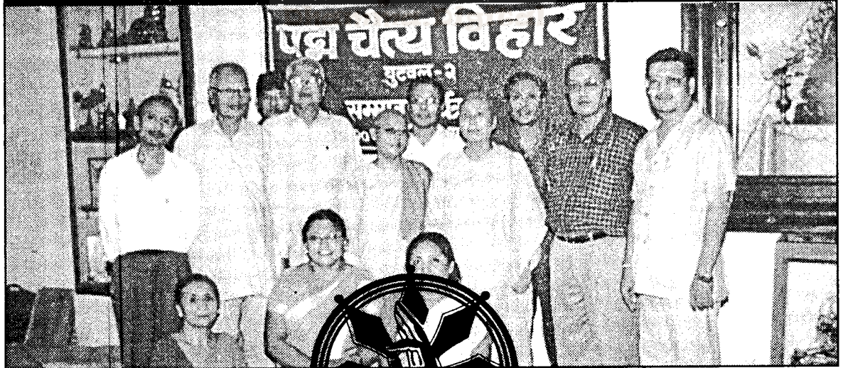
पद्म चैत्य विहारको उद्घाटन कार्यक्रममा प्रव्रजित गुरुमाँहरू