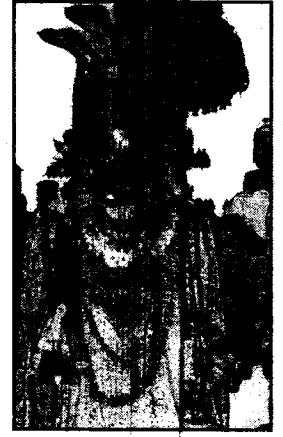
दीपंकर बुद्धको मूर्ति

स्वयम्भू स्थित भुइव्यःमा सम्पन्न गरिएको छ । श्री ५ महाराजाधिराज ज्ञानेन्द्र वीर विक्रम शाहदेव सरकारको प्रमुख आतिथ्यमा सम्पन्न उक्त समारोहमा दीपंकर बुद्ध प्रमुख बोधिसत्त्व करुणामयका मूर्तिहरू र अन्य थुप्रै देवताका मूर्तिहरू पनि सजाइएका थिए ।