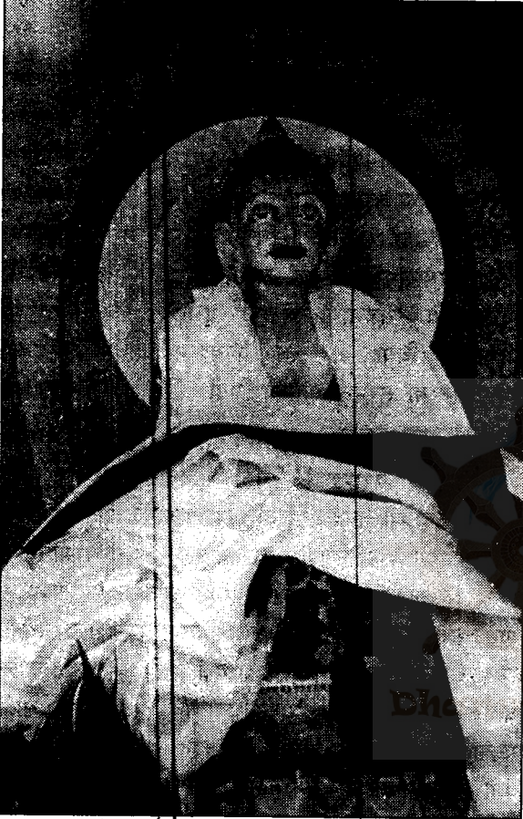
भद्रबन्दी गृह प्रतिक्षालय हातामा नवनिर्मित बुद्ध प्रतिमा

२०६१ वैशाख १७, भद्रबन्दी गृह, जगन्नाथ देवल, त्रिपुरेश्वर काठमाडौं ।