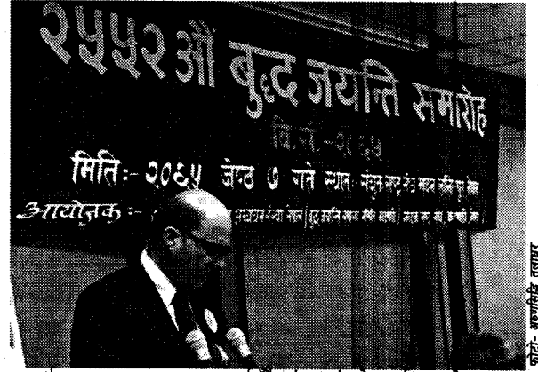
कार्यक्रममा मन्तव्य व्यक्त गर्नुहुँदै सं.रा.सं.को तर्फबाट नेपालका निमित्त अवसिय प्रतिनिधि

७ ज्येष्ठ, २०६५, सं.रा.सं.ले बुद्धजयन्तीको दिनलाई अन्तर्राष्ट्रिय मान्यता दिएको उपलक्ष्यमा काठमाडौं स्थित