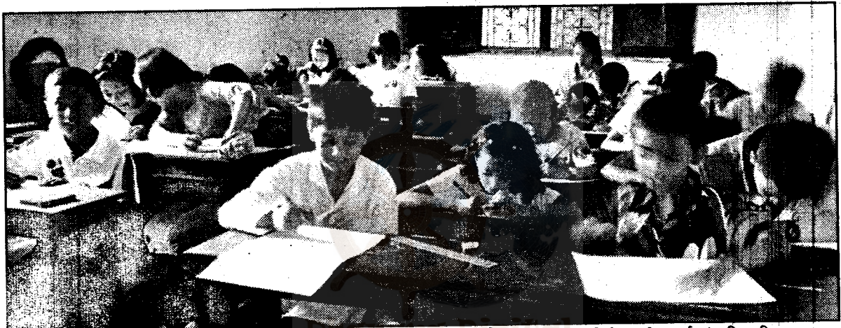
भिक्षु अश्वघोष महास्थविरको ८३ औं जन्मोत्सवको उपलक्ष्यमा धर्मकीर्ति बौद्ध अध्ययन गोष्ठीको आयोजनार्थ संचालित चित्रकला प्रतियोगितामा भाग लिइरहेका बाल-बालिकाहरू