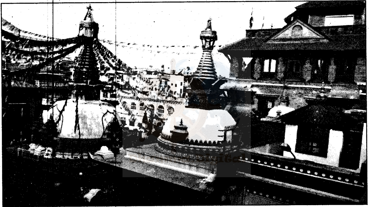
चैत्यहरूको माझमा अवस्थित धर्मकीर्ति विहार