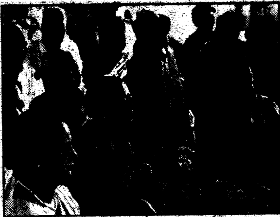
पट्टान पाठ श्रवण गर्नुहुँदै उपासक-उपासिकाहरू

थियो । उक्त कार्यक्रममा निर्माण पूर्ण किण्डोल विहारको तर्फबाट धर्मकीर्ति ज्ञानमाला भवनलाई रु १०००/- चन्दा स्वरूप प्रदान गरिएको थियो । यसरी नै धर्मकीर्ति ज्ञानमाला भवनको तर्फबाट पनि यस संस्थाको सम्मन्धाको भित्तो किण्डोल विहारलाई जडाइएको थियो ।