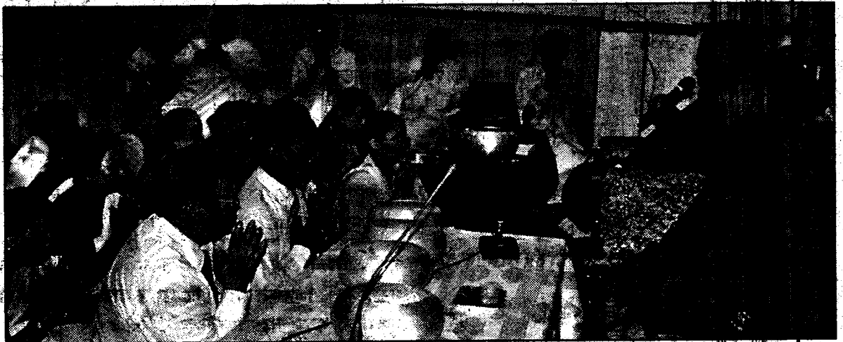
बर्मी राजदूतद्वारा अभिधम्मपाठे श्रवण गर्नुहुँदै