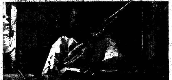
पट्टान पाठ गर्नुहुँदै दो मुणवती गुरूमा

यसको साथसाथै धर्मकीर्ति विहारका अन्य गुरूमाहरू लगायत उपासकोपासिकाहरूले पनि उहाँहरूलाई दान प्रदान