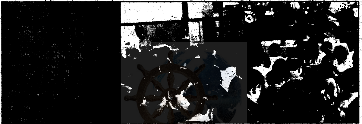
भन्तेहरूको तर्फबाट साप्ताहिक अभिधर्म पाठ हुँदै गरेको दृश्य

भिक्षु महासंघको तर्फबाट विहान ७ बजे देखि ९ बजेसम्म साप्ताहिक अभिधर्म पाठ एवं धर्मदिराना र असार २५ गते वज्रयानी गुरुजु र गुरुमाहरूको तर्फबाट वज्रयानी पाठ सम्पन्न गरिएको थियो । यसको विस्तृत विवरण यसरी रहेको छ ।