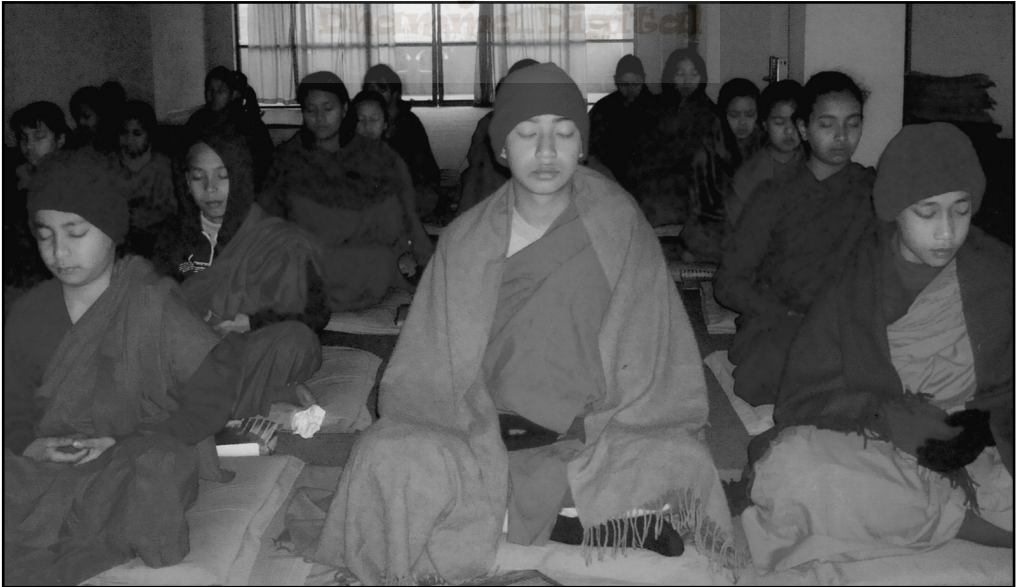
ध.की. बौ. अध्ययन गोष्ठीद्वारा सञ्चालित अल्पकालिन श्रामणेर एवं ऋषिणी प्रव्रज्या कार्यक्रममा सहभागी बालबालिकाहरू ध्यान अभ्यास गर्दै।

सहभागी बालबालिकाहरूलाई नैतिक शिक्षा, ध्यानभावना सरसफाई, श्रमण जीवनका शिक्षाहरू एवं अन्य रोचक र रचनात्मक प्रशिक्षणहरू पनि सिकाइएको उक्त साप्ताहिक कार्यक्रमको विवरण यसरी रहेको छ।