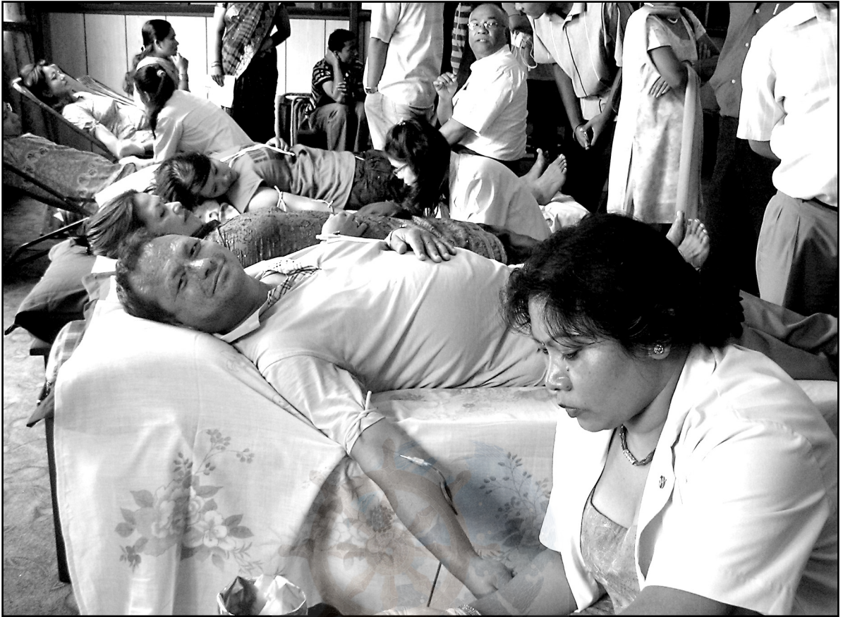
धर्मकीर्ति विहारले आयोजना गरेको रक्तदान कार्यक्रममा रगत दान गर्दै रक्तदाताहरू