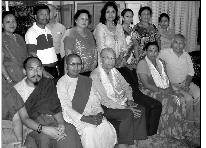
धर्मकीर्ति संरक्षण कोषया पदाधिकारीपिं

पाखें भजन म्ये व पिक्चर फिल्म धर्मकीर्ति विहार छपुलु व पटाचारा प्याखें प्रदर्शन याःगु खः । उगु ज्याइवःलयु नेपाल, भारत, म्यानमार, श्रीलंका, कोरिया, चीन, जापान आदि देश पिनि पाखें नं व्वति काःगु खः ।