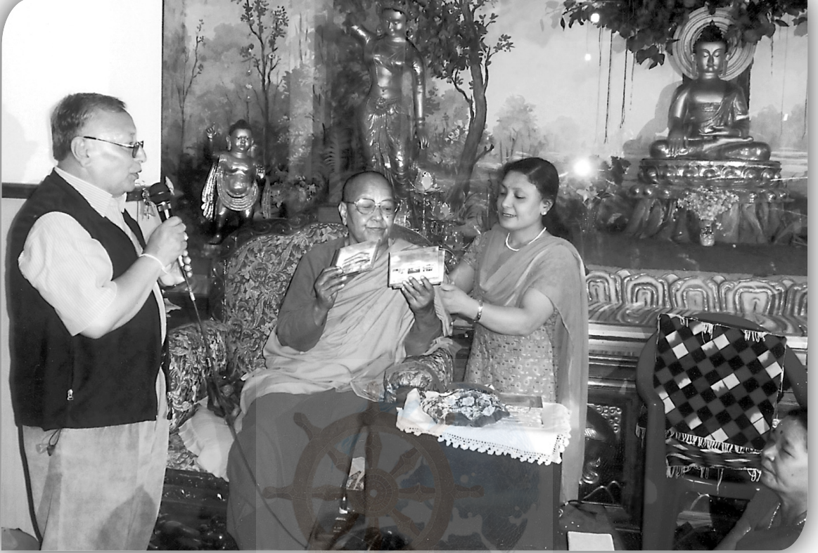
धम्मवती गुरुमाया ल्हातं डकुमेन्ट्री उद्घाटन