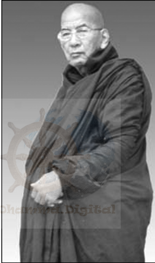
जन्म: वि.सं. १९७८ आश्विन शुक्ल एकादशी दिवंगत : वि.सं. २०६८ आश्विन ७ गते शनिवार

थियो । तत्कालीन श्री ३ जुद्ध शम्शेर महाराजले वि.सं. २००१ श्रावण १५ गतेका दिन आठजना नेपाली भिक्षु-श्रामणेरहरूलाई स्वदेशबाट निकाला गरेको कलंकित इतिहास जीवित नै छ । क्रूरतम अमानवीय देश निकालाको त्यो कालो दिवसले बुद्धधर्म र नेपालभाषा-भाषेलीहरूमा भन्नु उर्जा प्रदान गरेभै भयो । त्यसका विरुद्ध विभिन्न अभियानकै लागि वि.सं. २००१ कार्तिक १५ गतेका दिन सारनाथमा “धर्मोदय सभा”को गठन हुन्छ ।