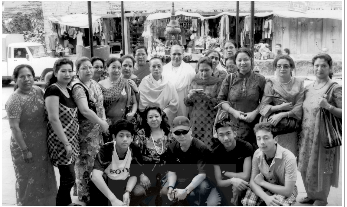
भ्रमण कार्यक्रममा सहभागी उपासकोपासिकाहरूका साथ इन्दावती गुरुमां र मेत्तावती गुरुमां