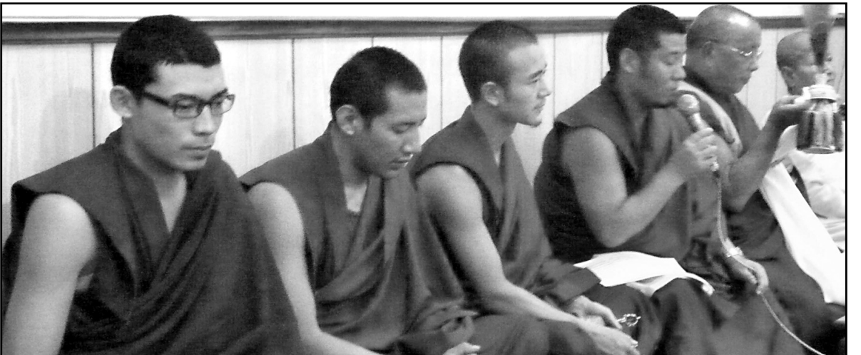
शान्ति पाठ गर्नुहुँदै महायानी लामागुरुहरू

सप्ताहव्यापी कार्यक्रम अवधिभर विभिन्न गुरुमांजरू लगायत उपासकोपासिकाहरूको तर्फबाट भन्ते गुरुमांजरूलाई भोजन, जलपान र बुद्धपूजा कार्यक्रममा सहभागी उपासकोपासिकाहरू सबैलाई जलपान दान गरी पूण्य सञ्चय गरेका थिए ।