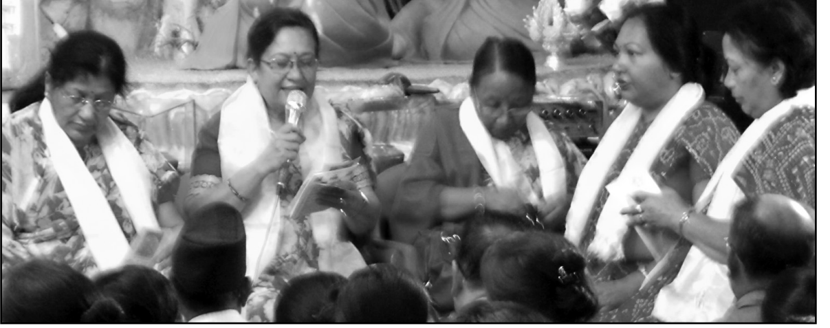
पञ्चरक्षा पाठ गर्नुहुँदै वज्रयानी गुरुमांजुहरू

प्रचार कार्यमा पुऱ्याउनु भएको योगदानलाई कदर गर्नु हुँदै धर्मदेशना गर्नुभएको थियो ।