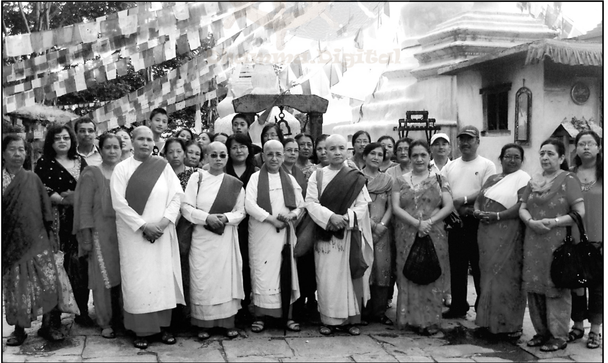
नमो बुद्ध भ्रमणमा सहभागी उपासकोपासिकाहरूका साथ गुरुमांहरू

धर्मदशेना गर्नुहुँदै भन्नुभयो— बुद्ध बन्ने अठोट लिएका बोधिसत्वले दान पारमिता, (आफूसंग भएका धन सम्पत्तिहरू दान दिने), दान उपपारमिता (आफ्नो शरीरको कुनै पनि अङ्ग त्याग गरी दान दिने) मात्र होइन दान परमत्थ पारमिता (प्राण समेत त्याग गरी दान दिने) नै पूरा गर्नपछि हट्दैन । उक्त कार्यक्रममा भाग लिएका धेरैजसो यात्रुहरूले आफ्ना परिवारका दिवंगत हुनुभएका सदस्यहरूको पूण्य स्मृतिमा दान प्रदान गरी प्रदीप वाली पूण्य सञ्चय गरेका थिए ।