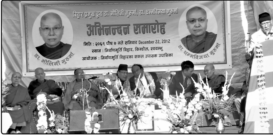
अभिनन्दन समारोह सञ्चालन भइरहेको एक दृष्य