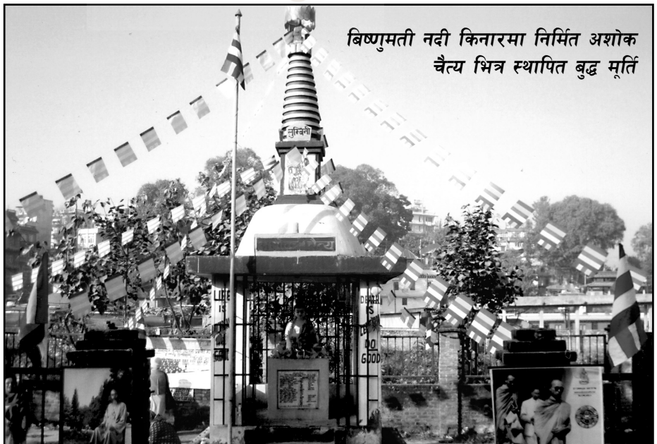
बिष्णुमती नदी किनारमा निर्मित अशोक चैत्य भित्र स्थापित बुद्ध मूर्ति

धर्मदेशना पश्चात् दानप्रदान एवं पूण्यानुमोदन गरी कार्यक्रम समापन गरिएको थियो ।