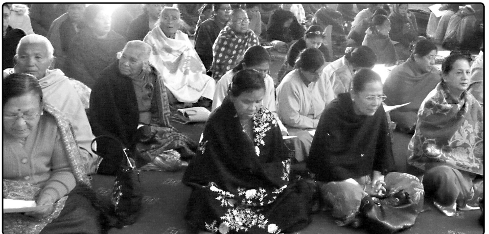
मैत्री सूत्र पाठ श्रवण गर्नुहुँदै उपासकोपासिकाहरू

परिवर्तन भइसकेका प्राणीहरूको सुख शान्ति एवं उद्धार हेतु निर्वाण मूर्ति विहारबाट सञ्चालन गर्दै आइरहेको यस कार्यक्रमले यसपाली पाँचवर्ष पूरा गरेको बुझिएको छ ।