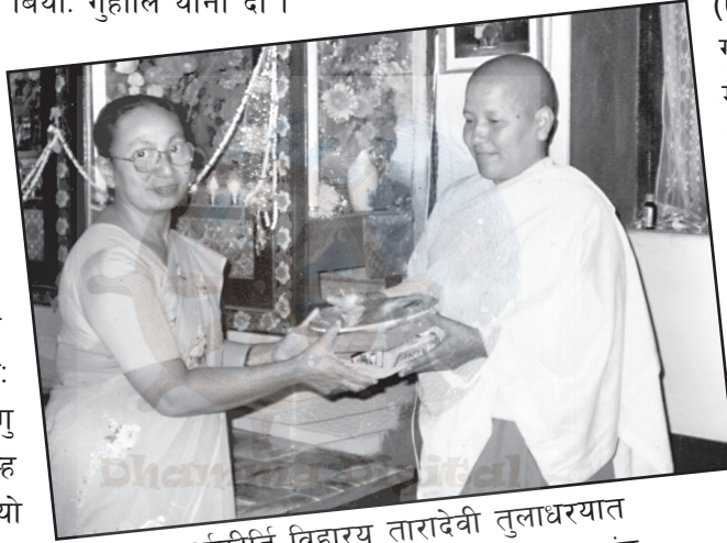
धर्मकीर्ति विहारय् तारादेवी तुलाधरयात धम्मवती गुरुमां नं सिरपा लःल्हाना च्वंगु

वय्कलं नर्सिङ्ग पेशाय् समर्पित जुसानिसे तुयूगु वसतय् यचुक ड्यूटी जुइगु हे ययेका दिल । ल्यासेगु वैसय् थुकथं जुइगु छम्ह मिसाया तःधंगु त्यागया खँ खः । वय्कःया पासापिं ड्यूटी सिधय्काः अस्पतालं पिहां वन कि थः यःकथं बांलाक श्रृंगार याना जुइगु जुयाच्वन । तर वय्कलं ड्यूटी दुने नं पिने नं सादा जुइगु हे ययेका दिल । जीवनया अन्त तकं सादा जीवन उच्च विचारय् च्वनादीम्ह वय्कः छम्ह विशिष्ट व्यक्ति खः । आधुनिक संसारनाप नं भ्यलय् पुनाः थःगु विचार ज्ञानयात न्हूधाः