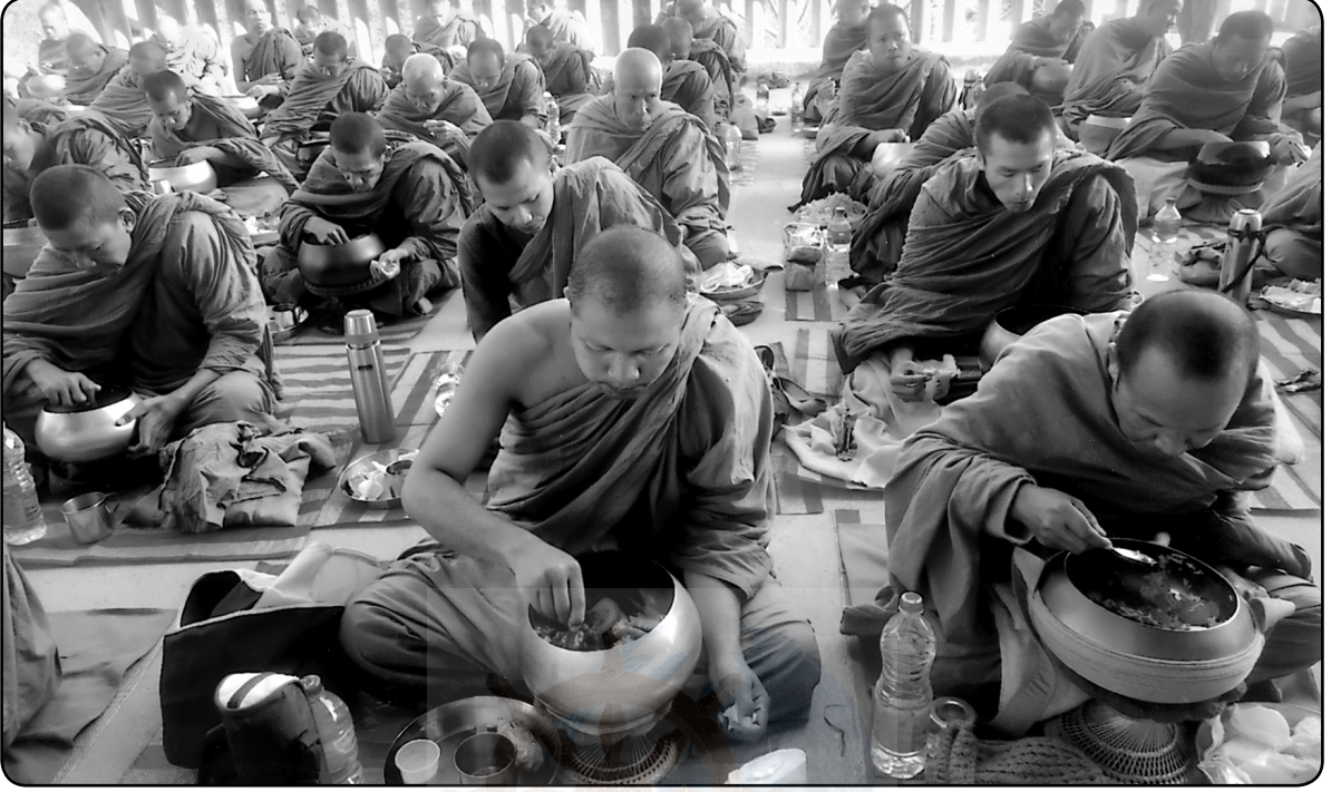
लुम्बिनी कोरियन विहार प्राङ्गणय् पालय् दुने भिक्षा भोजन यानाचवना विज्याःपिं धुताङ्गधारी भन्तेपिं

२०६९ चैत्र १२ गते स्थान- लुम्बिनी प्रस्तुती- अनुपमा गुरुमां