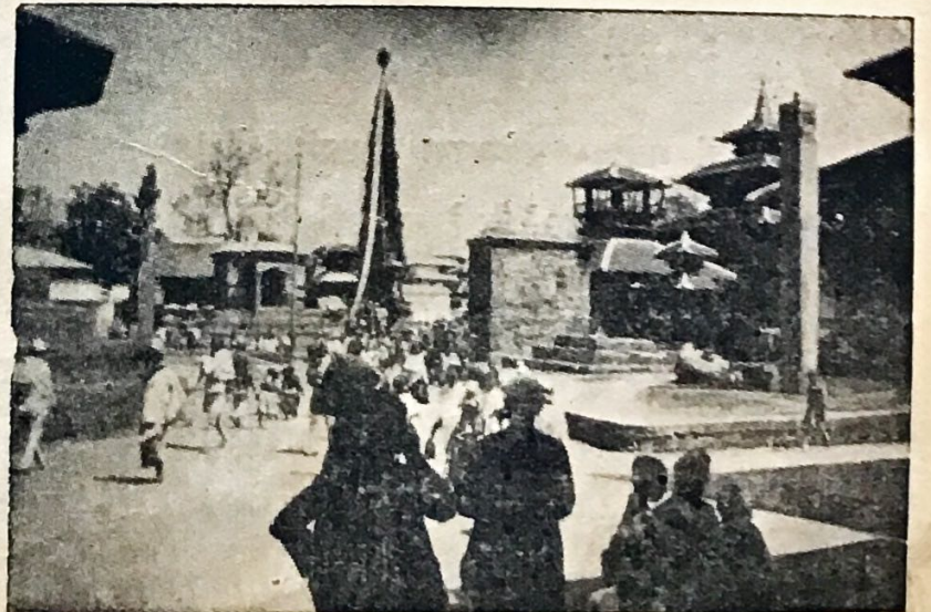
लायकुली जनबहाचोया रथ