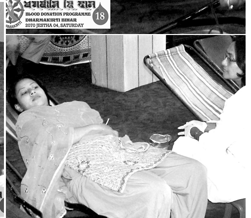
बु.सं. २५५७ औं वैशाख पूर्णिमाको उपलक्ष्यमा धर्मकीर्ति विहारमा रक्तदान गर्दै गुरुमां, भन्ते तथा रक्तदाताहरू