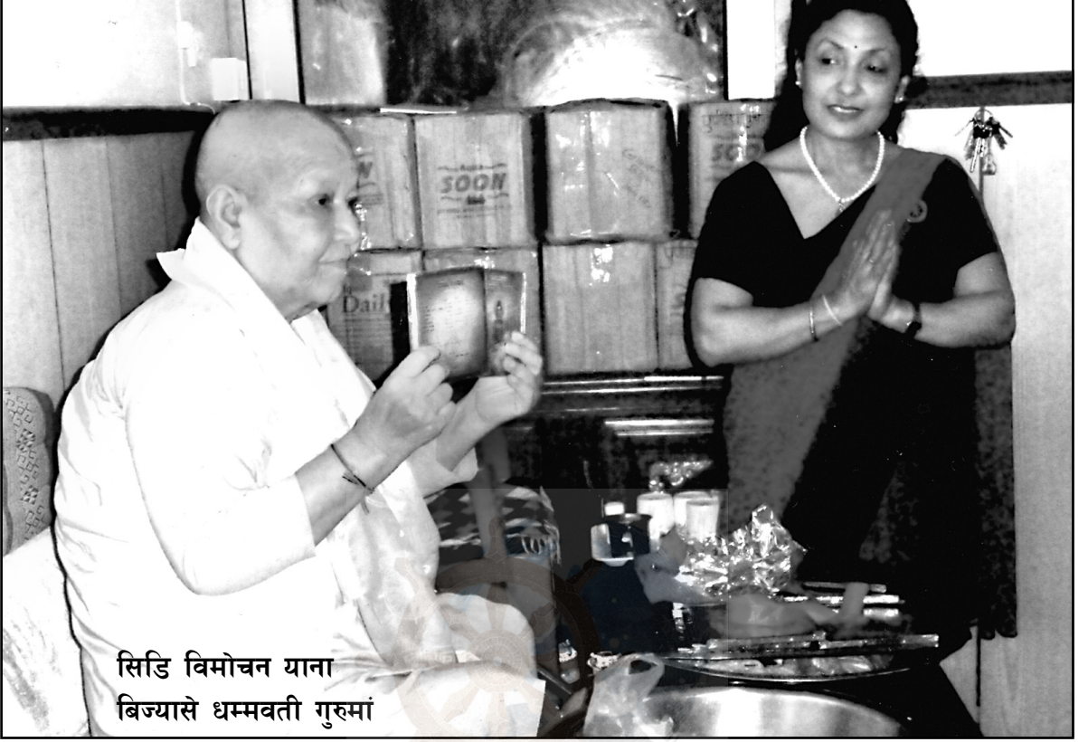
सिडि विमोचन याना बिज्यासे धम्मवती गुरुमां