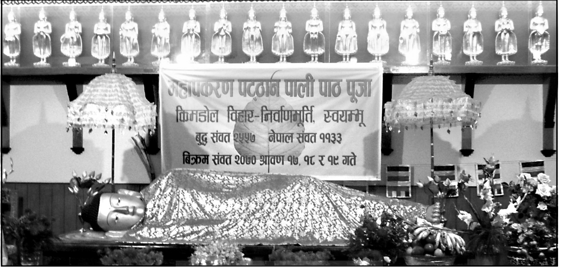
किण्डोल विहारस्थित बुद्ध निर्वाण मूर्ति