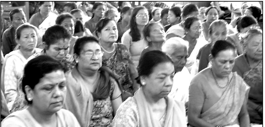
पट्टान पाठ श्रावण गरिरहेका उपासकोपासिकाहरू

स्मरणिय छ, किण्डोल विहारले हरेक वर्ष पट्टान पाठ कार्यक्रम सञ्चालन गर्दै आएकोमा यो आठौं पटकको हो ।