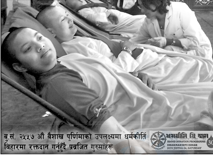
बु.सं. २५५७ औं वैशाख पूर्णिमाको उपलक्ष्यमा धर्मकीर्ति विहारमा रक्तदान गर्नुहुँदै प्रव्रजित गुरुमांहरू