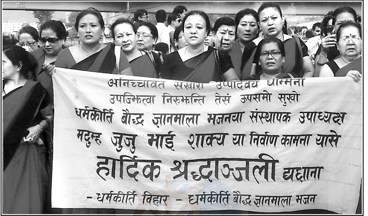
धर्मकीर्ति बौद्ध ज्ञानमाला भजनया पदाधिकारीपिं ब्यानर ज्वंसे श्रद्धाञ्जली प्वंकाच्वंगु