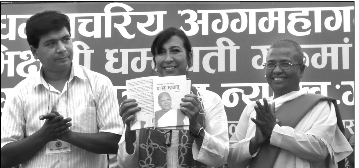
पुस्तक विमोचन गर्नुहुँदै प्रमुख अतिथि हाना सिंगर

ब्याङ्क्वेट भित्र सजाइएको मञ्चमा विराजमान गराइसकेपछि सम्मान कार्यक्रम आरम्भ गरिएको थियो ।