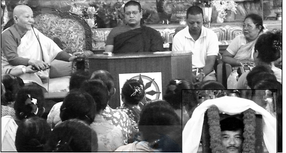
ओवाद न्वचू बिया बिज्यासे धम्मवती गुरुमां