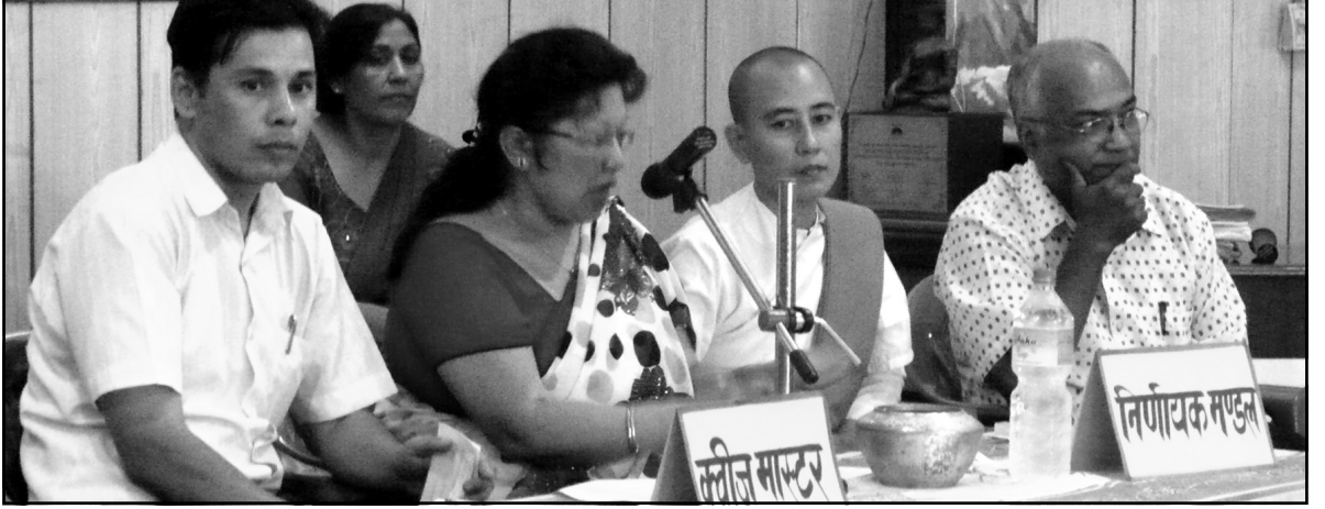
प्रश्न सोध्न तल्लीन क्वीज माष्टरहरूका साथ निर्णय गर्ने कार्यमा तल्लीन निर्णायकहरू