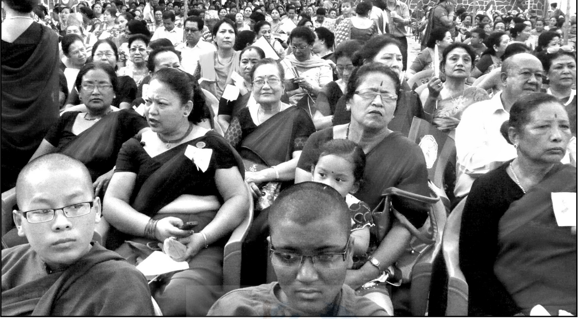
सम्मान कार्यक्रममा उपस्थित जनसमूह

उचित स्थान दिनुभएको विषयमा प्रकाश पार्नुभयो ।