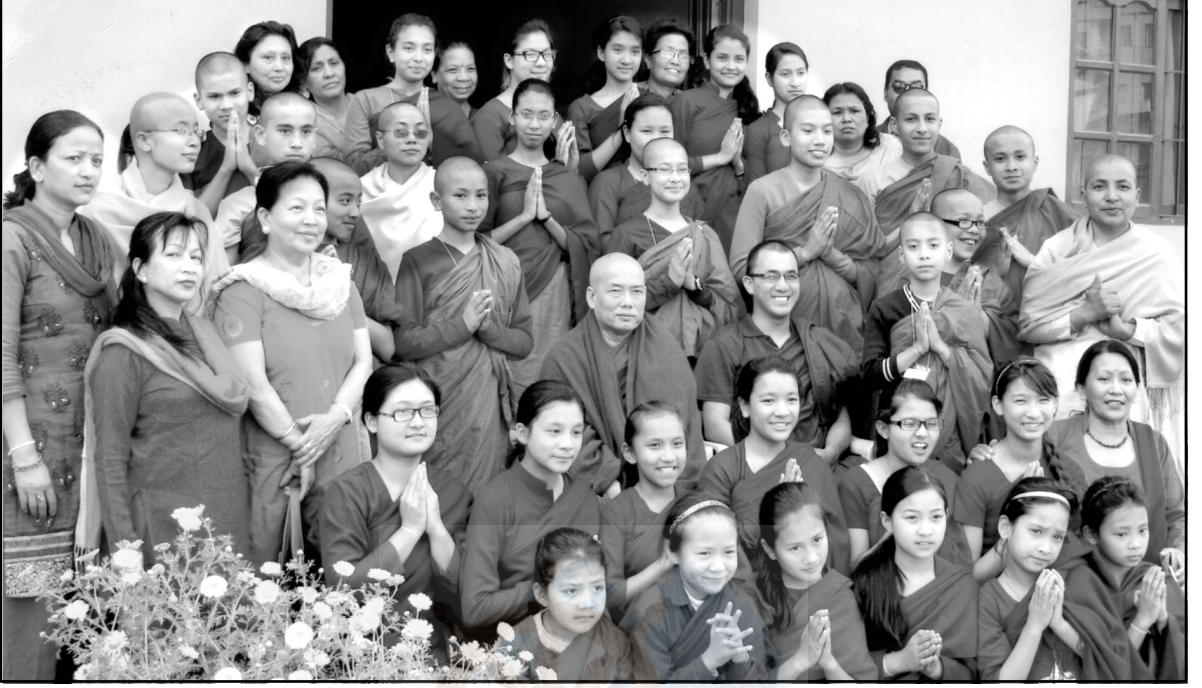
अल्पकालिन प्रव्रज्या समारोहमा सहभागी श्रामणे र एवं ऋषिणी बाल बालिकाहरू, साथमा प्रशिक्षकहरू