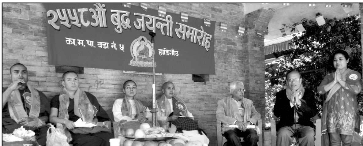
हाँडिगाउँमा बुद्ध जयन्ति महोत्सव कार्यक्रम सञ्चालन हुँदै