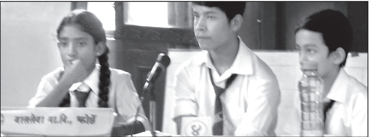
बौद्ध हाजिर जवाफ प्रतियोगितामा सान्त्वना पुरस्कार प्राप्त गर्न सफल बाल सेवा मा.वि.का सहभागी विद्यार्थीहरू