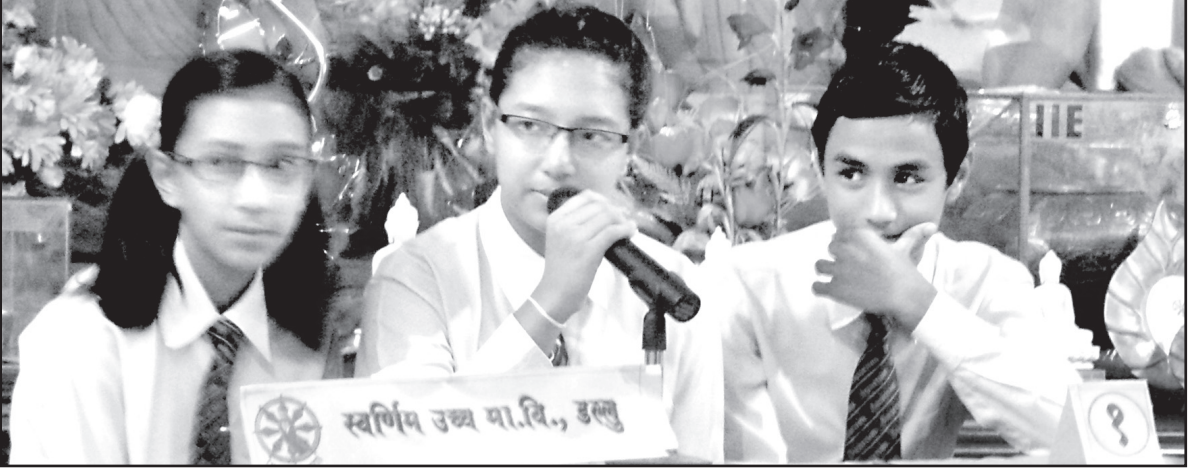
बौद्ध हाजिर जवाफ प्रतियोगितामा दोश्रो स्थान प्राप्त गर्न सफल स्वर्णिम मा.वि.का प्रतियोगीहरू