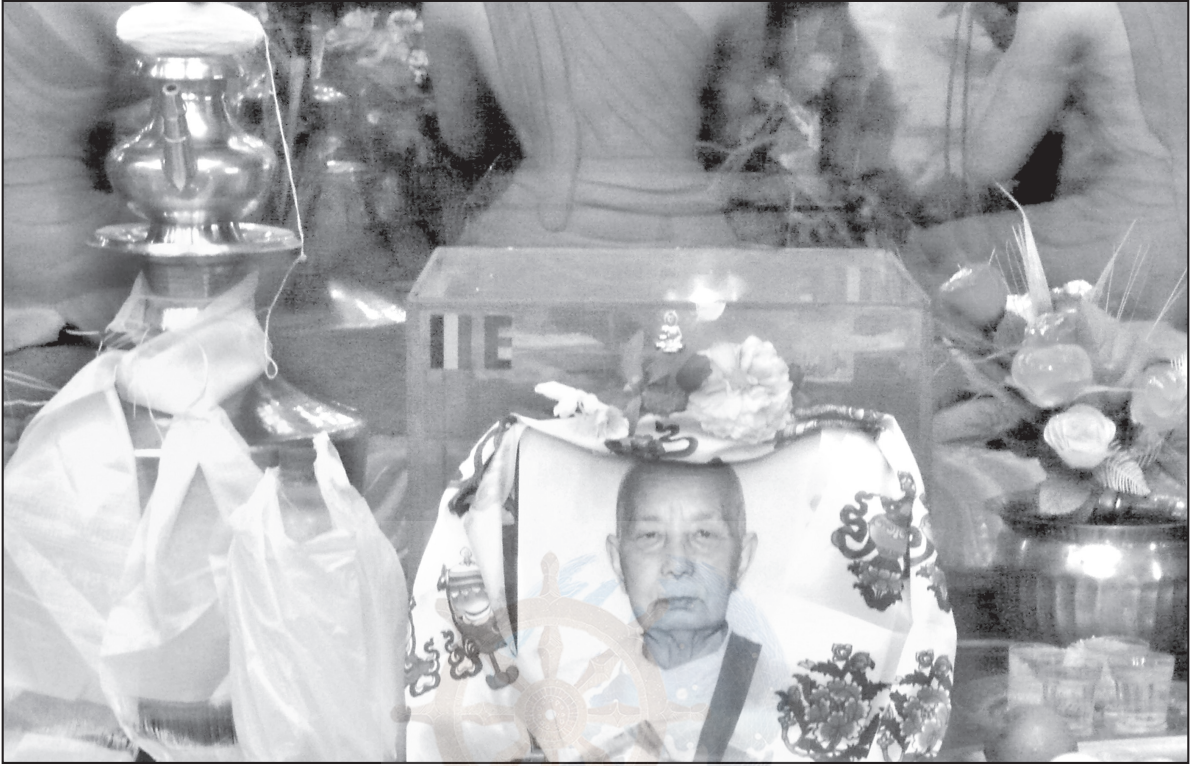
दि. रत्नमञ्जरी गुरुमां

२०७१ आश्विन २० गते, सोमवार स्थान- धर्मकीर्ति विहार